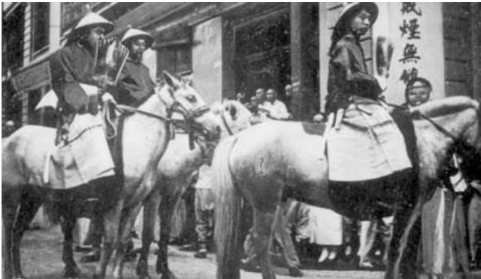
巡视戒烟的清朝官员