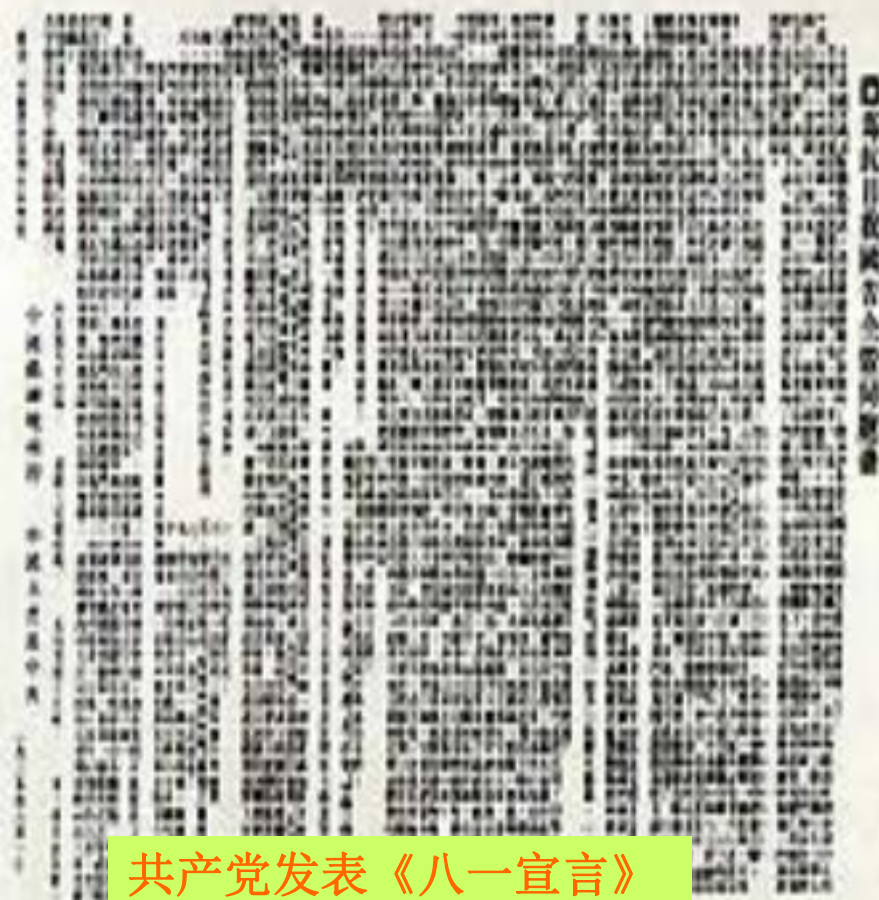
共产党发表《八一宣言》