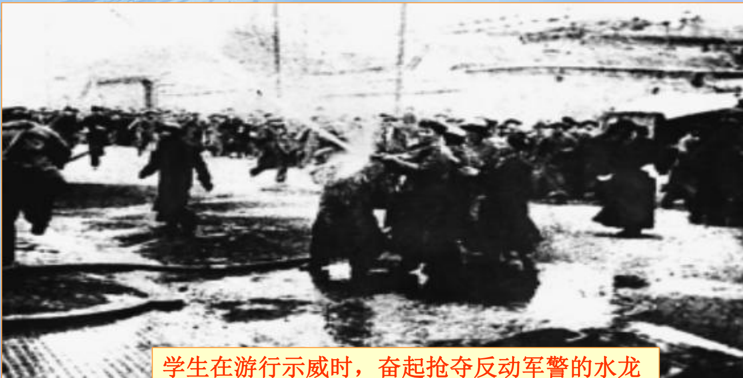
学生在游行示威时，奋起抢夺反动军警的水龙