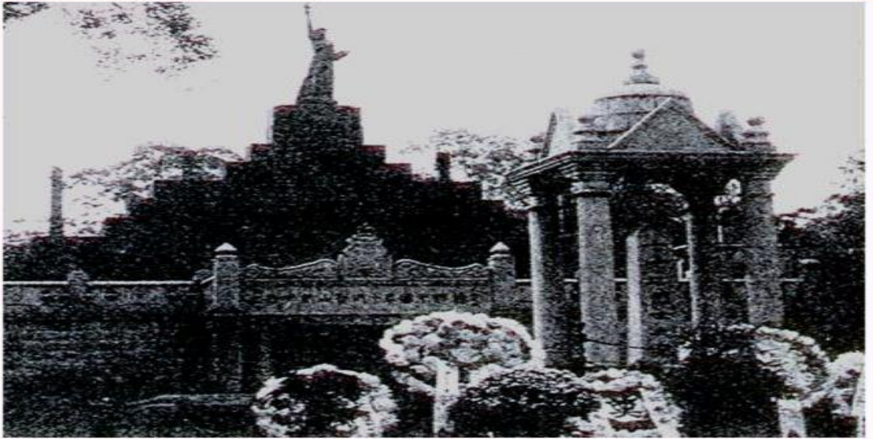
黄花岗七十二烈士墓址