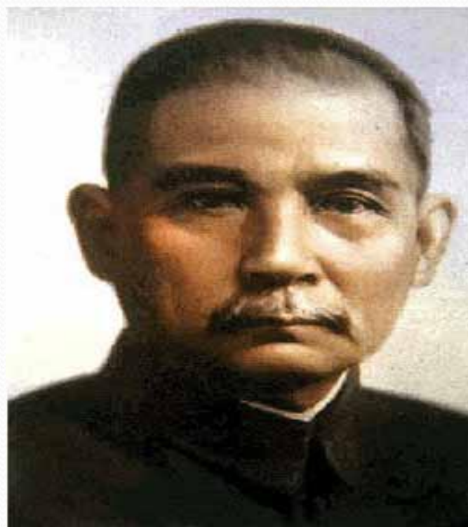
伟大的民主革命先行者孙中山