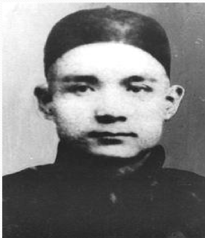
青年时代的孙中山