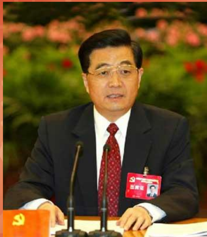
胡锦涛在党的十六大三中全会上

——引自《中共中央关于完善社会主义市场经济体制若干问题的决定》（2003年10月14日中国共产党第十六届中央委员会第三次全体会议通过）