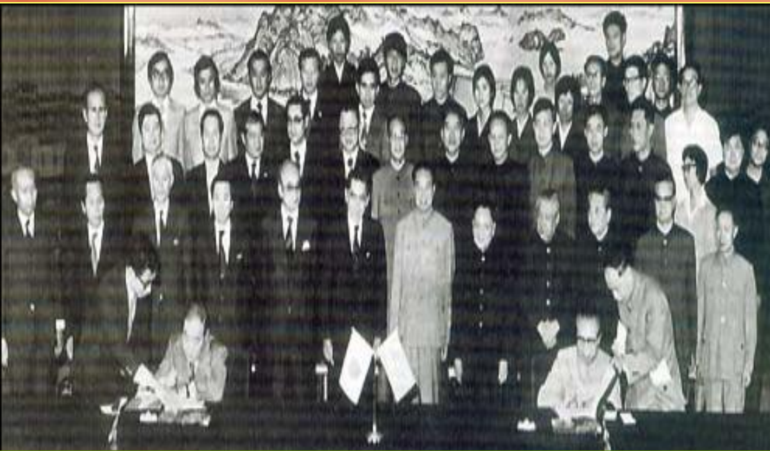
1978. 8. 12. 《中日友好条约》的签字仪式在北京隆重举行

1978年8月12日，1979年1月1日，分别与日本、美国实现外交关系正常化，为中国进行改革开放和现代化建设提供了有利的外部条件。