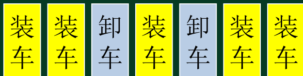
插花进货货位使用示意图