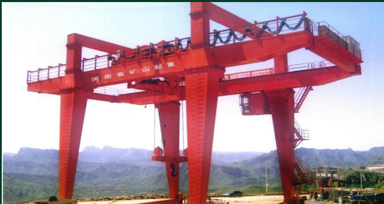
起重40吨起升高度400米门式双梁起重机