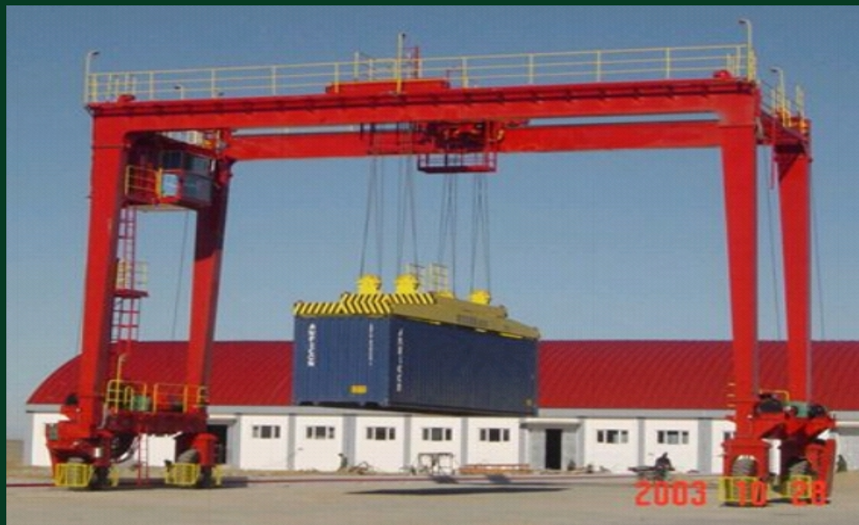
轮胎式门式起重机