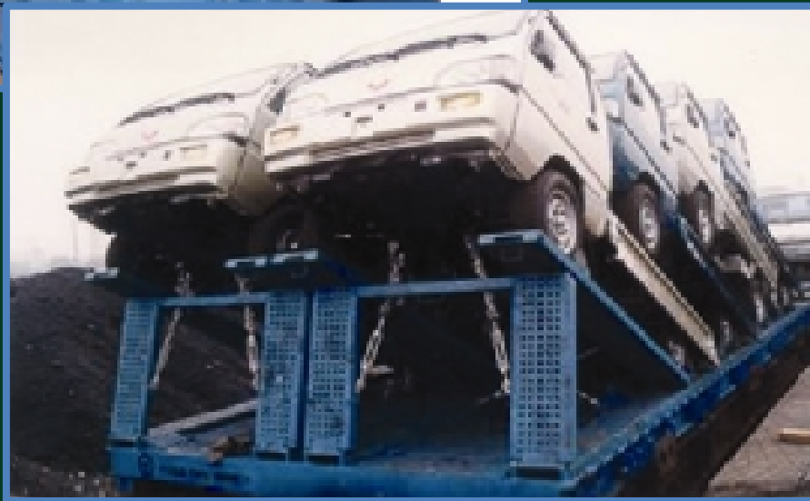
25英尺 台架式汽车箱